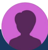
Thérèse Bourhis Ancienne Maire de Trémel

A ma grande surprise, les réunions proposées par le pôle ont attiré de nombreux habitants, anciens, nouveaux, de tout âge. Ce furent des échanges très riches, en différents ateliers où chacun a exposé ses souhaits les plus divers. (...) »»